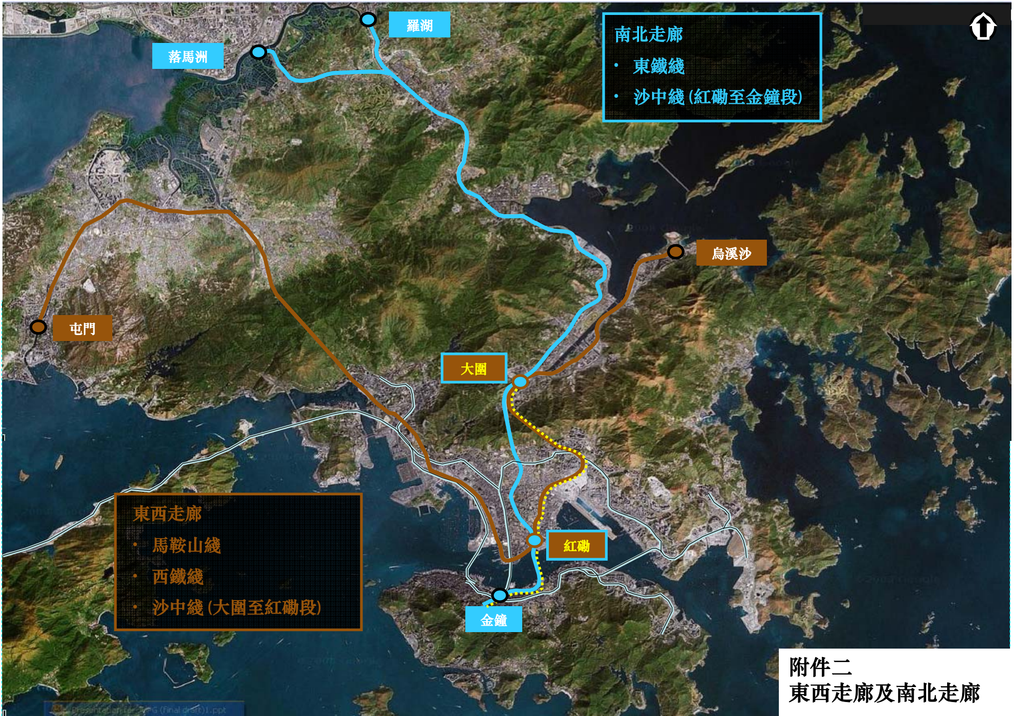
附件二 東西走廊及南北走廊