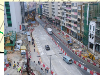
馬頭圍道工地現況