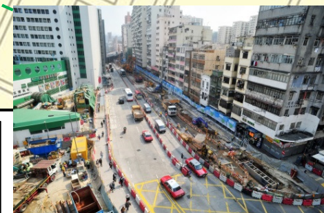
馬頭圍道工地現況