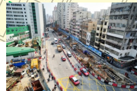
馬頭圍道工地現況