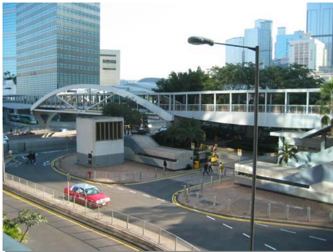
改建現有金鐘 站E1和E2出口