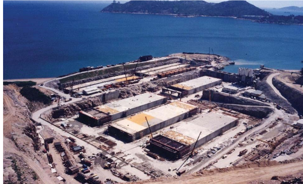
沉管隧道預製組件 IMT precast units